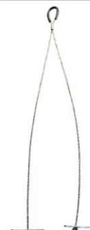
Code LUM Système "Y" avec cheville basculante charge 10 à 35 kg