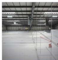
Armatures Unités clim Signalétique