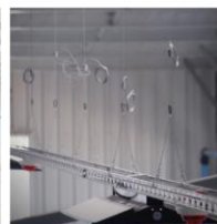
Armatures / Rails Chemins de câbles Panneaux isolants