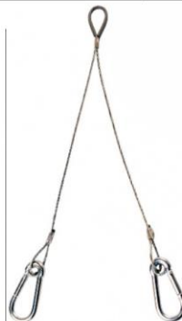
Code TRS Système "Y" avec 2 mousquetons charge 50 kg