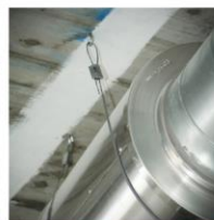
Tout type de béton