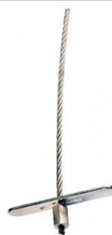
Code PTE Câble de suspension avec cheville basculante charge 10 à 35 kg